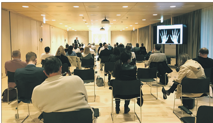
Gut besuchte Fortbildung in der Reha Rheinfelden