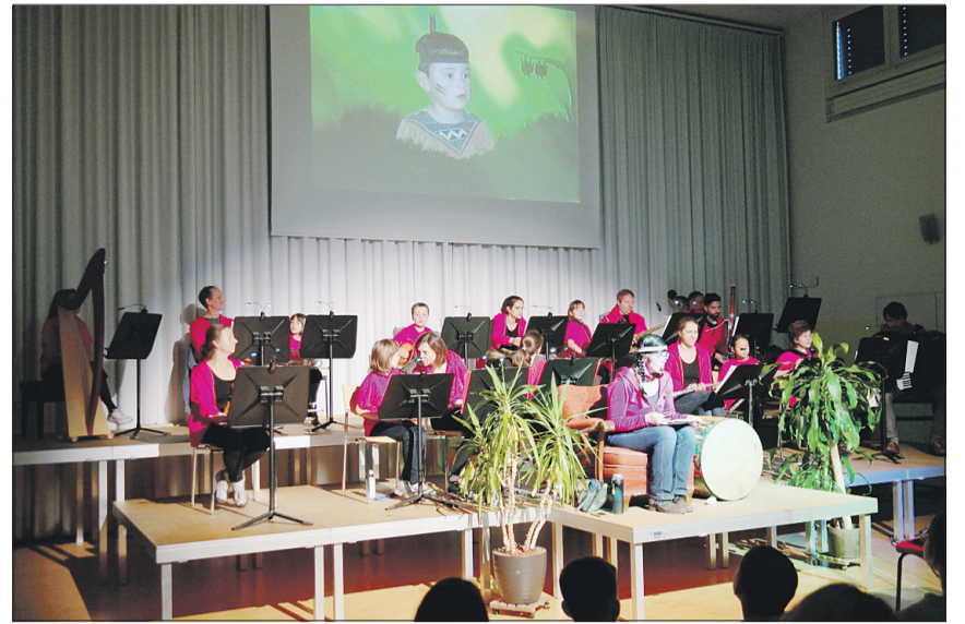
Das indianische Märchen zog die Schüler in seinen Bann